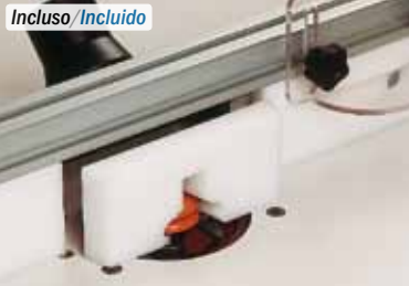
999.502.10_Guida con inserto sagomabile in polipropilene/Guía moldeable en polipropileno.