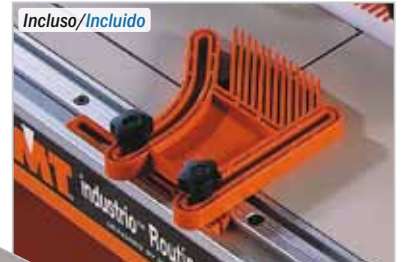
999.501.07_Pressore universale a pettine in ABS/Peine anticontraGolpe ABS.