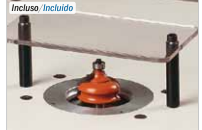
999.501.06_Doppio puntello con protezione per lavorazioni a mano/Pareja de pivotes con protección para trabajos manuales.

Dimensioni:/Tamaño: 79x59x(h)93cm. Peso 55 kg.