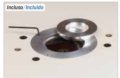
999.501.18_Piastra in fenolico con anelli per CMT7/Placa de fenólico con anillos para CMT7E (Ø103-69,5mm)